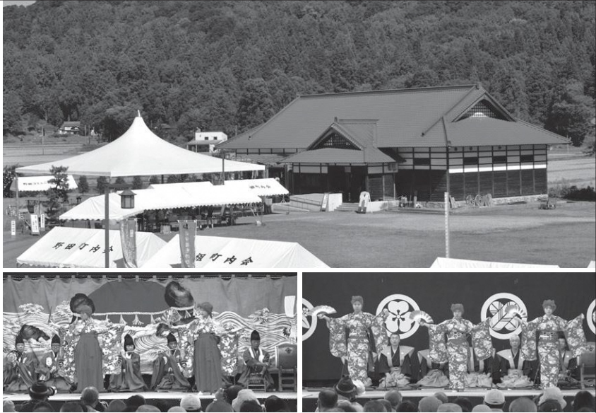
綾子舞会館（現地公開）

昭和51（1976）年5月4日、初期歌舞伎のおもかげを残す芸能として価値が高いと評価され、国の重要無形民俗文化財の第1回に指定を受けました。また、令和3（2021）年3月、ユネスコ無形文化遺産に綾子舞を含む「風流踊」が提案されています。